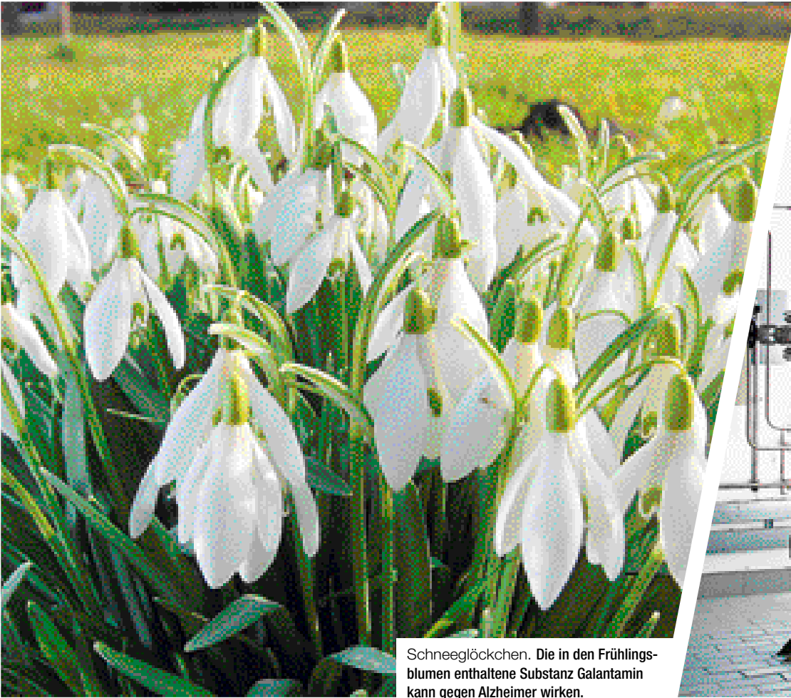
Schneeglöckchen. Die in den Frühlingsblumen enthaltene Substanz Galantamin kann gegen Alzheimer wirken.